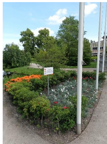
Ons anjerperkje, dankzij de gemeente weer volop in bloei

Een van onze veteranen die houtbewerking als hobby heeft, kwam met het mooie initiatief om van hout van gekapte bomen een bankje te maken bij ons anjerperkje.