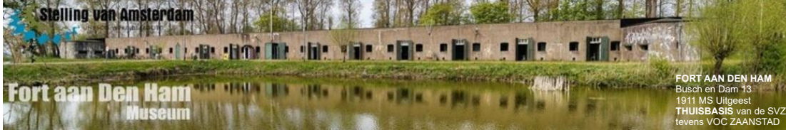
Stelling van Amsterdam Fort aan Den Ham Museum

FORT AAN DEN HAM Busch en Dam 13 1911 MS Uitgeest THUISBASIS van de SVZ tevens VOC ZAA NSTAD