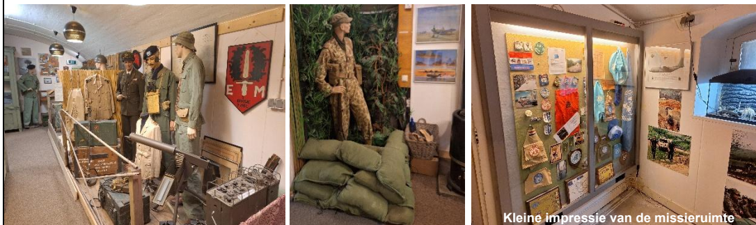
Kleine impressie van de missieruimte

Het Fort aan den Ham heeft een rijke geschiedenis in de stelling van Amsterdam, maar is niet alleen ingericht zoals het er omstreeks 1914 uitzag. Ook huisvest het Fort een Missieruimte met exposities over WO-1, WO-2 en naoorlogse missies.