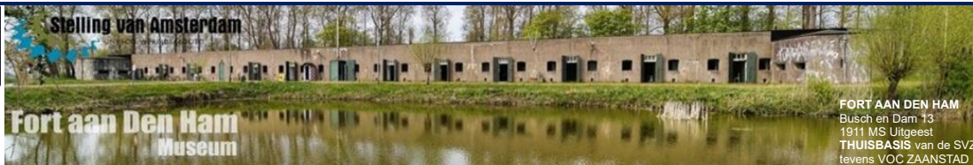
FORT AAN DEN HAM Busch en Dam 13 1911 MS Uitgeest THUISBASIS van de SVZ tevens VOC ZAAANSTAD