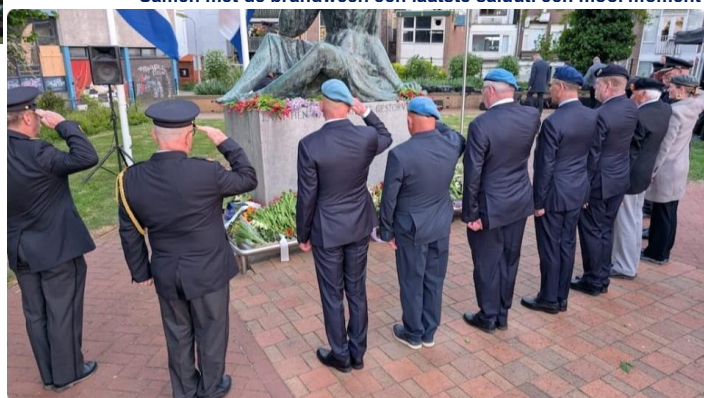
Samen met de brandweer. een laatste saluut. een mooi moment