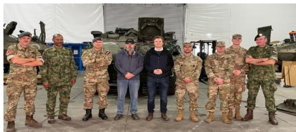
Op links tijdens media moment met de Minister van Defensie

Op 26 september 2024 vertrok ik als vrijwilliger voor mijn missie onder de vlag van Task Force Oekraïne naar Polen op de lijn Rzeszow - Lviv Oekraïne. Ik was hier geplaatst met mijn ploeg van drie Nederlandse musketiers (van MOVECON en MAINTENANCE) als NLD NLO (National Logistics Officer) in een team van internationale collega's.