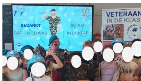
Even met de klas op de foto altijd weer leuk

Als gastspreker vertel je jouw eigen unieke verhaal over jouw missie(s). Je bent vrij in hoe je dat doet. Zelf heb ik een PowerPoint met korte filmpjes en veel (persoonlijke) foto's. Er zit geen verplichting aan van bijv. een minimaal aantal gastlessen dat je moet geven, het is dus echt op vrijwillige basis. Natuurlijk moet je wel een klas leerlingen uit groep 7 (evt. 8) kunnen boeien met jouw verhaal.