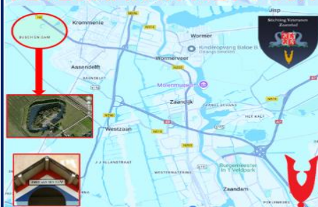
Vlak naast de NS en de spoorlijn van Zaanstad richting Alkmaar en Den Helder ligt het geschiedrijke Fort aan den Ham (Busch en Dam 13 Uitgeest).

Met de bouw van het fort is begonnen in 1896 en het was klaar in 1903. Het was een van de 42 forten van de stelling van Amsterdam. Aanvankelijk gebouwd als in gebakke grintsteen met een verdedigingsfunctie, bracht het tijdens de eerste wereldoorlog en een half eeuw van de tweede wereldoorlog onderdak aan Nederlandse gemeentelijke militairen. In de oorlogsjaren 1940-1945 werden er 8000 militairen gehuisvest en vandaag de dag brengt het bezoek aan de site van de aanleggroep De Cassiers uit Alkmaar en hebben de Veteranen uit Zaanstad of hun Thuisbasis. Ook vinden er jaarlijks evenementen plaats (zo zijn: een militair weekend, tin potten, modelspoorbouw) en zijn vele ruimtes van het fort ingericht als museum.